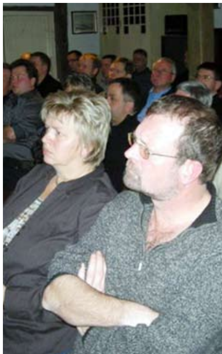
Der var stort fremmøde i Håndværkerhuset til orienteringsmødet om Aalborg Kommunes SMV-venlige udbuds- og indkøbspolitik